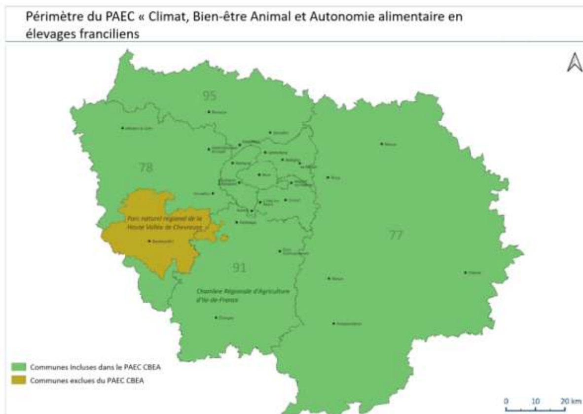
Carte du périmètre du PAEC « Climat, Bien-être Animal et Autonomie alimentaire et élevage franciliens »

Le périmètre du PAEC « Climat, Bien-être Animal et Autonomie alimentaire en élevages franciliens » regroupe l'ensemble des communes de la région Île-de-France à l'exception des communes comprises dans le périmètre du Parc naturel régional de la Haute Vallée de Chevreuse.